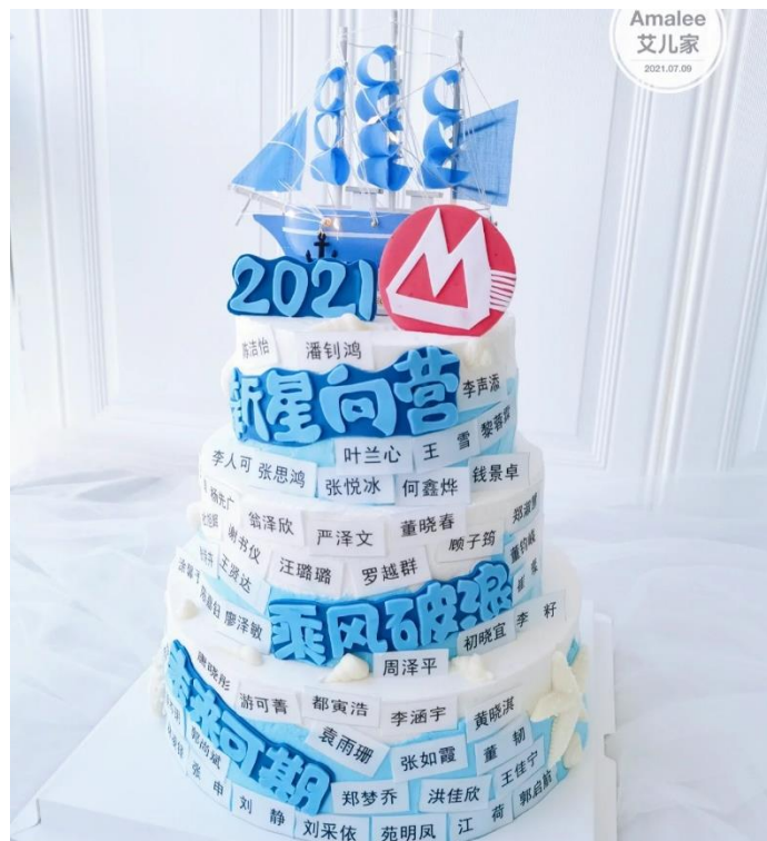
三层定制蛋糕示意图（定制参考）